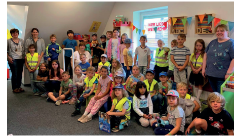
Vorschulkinder + 1. und 2. Klasse