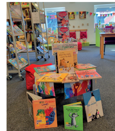
Buchausstellung Demokratie für Kinder

Im vergangenen Jahr kamen 4.350 Besucherinnen und Besucher (Kinder, Jugendliche und Erwachsene) zum Stöbern, Informieren, Ausleihen und zu verschiedenen Veranstaltungen in die Bücherei.