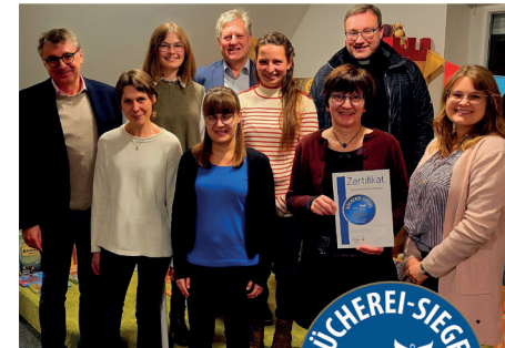
Übergabe des Gütesiegels

Er hob die besonderen Leistungen und die wichtige Rolle der Bücherei als Bildungsort hervor und lobte den langjährigen unermüdlichen Einsatz und die engagierte Arbeit des Teams. Ich möchte jedoch betonen, dass diese Auszeichnung nicht nur durch