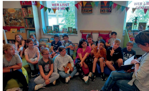
3. und 4. Klasse zu Besuch