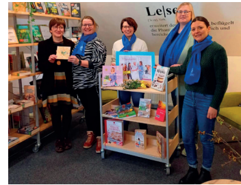
Spendenübergabe des Frauenbundes