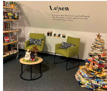
Adventszeit in der Bücherei