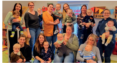
Krabbelgruppe zu Besuch